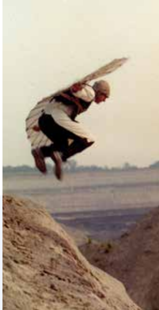
DAS LUFTSCHIFF (DDR 1982, Regie: Rainer Simon), © DEFA-Stiftung/Wolfgang Ebert

KAMERADSCHAFT [D/F 1931, Regie: Georg Wilhelm Pabst], Quelle: Deutsche Kinemathek